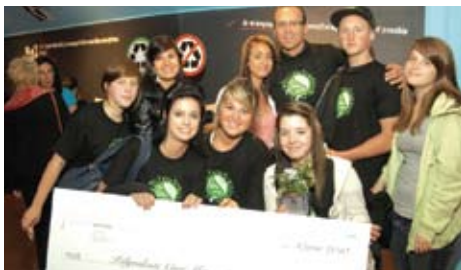
Gagnant catégorie 1er cycle du secondaire Polyvalente Curé-Mercure - Mont-Tremblant

Pour une 6 e année consécutive, la Fondation a tenu le concours La Palme verte destiné aux enseignants du primaire et du premier cycle du secondaire partout à travers le Québec.