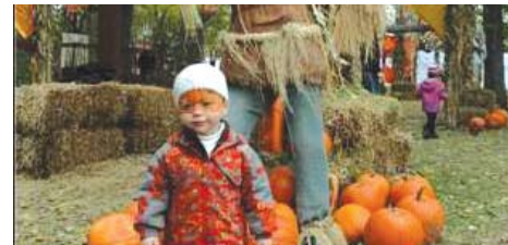
Journée familiale HSBC - Jardin botanique

l'équipe d'animation du Jardin botanique. Ce programme éducatif invite les élèves à devenir de jeunes chercheurs créatifs en participant à une démarche scientifique s'inspirant du merveilleux monde du vivant.